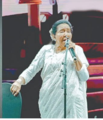
होत गेले, त्यामुळे त्यांचं निधन झालं. आशा भोसले यांना शनिवारी रुग्णालयात दाखल करण्यात आलं होतं. आज त्यांची प्राणज्योत मालवली आहे. उद्या सकाळी ११ ते २ या